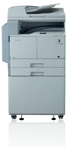
imageRUNNER 2202N ar papildu ADF, kaseti un parasto balstu