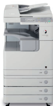
imageRUNNER 2530i ar papildu papīra kasetēm un DADF