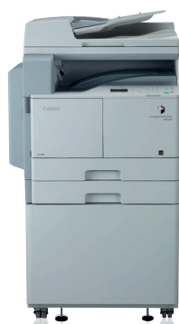
imageRUNNER 2202N ar papildu ADF, kaseti un parasto balstu

Mēs saprotam, ka, lai gan uzņēmumi saskaras ar kopējām problēmām, katrs uzņēmums ir unikāls. Tāpēc Canon kompaktajā imageRUNNER klāstā ietverta plaša A4 un A3 daudzfunkcionālo ierīču daudzveidība, lai jūs varētu atrast savām vajadzībām atbilstošāko risinājumu.