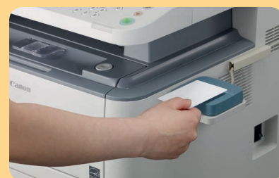
Papildu uniFLOW kartes autentifikācija

uniFLOW MyPrintAnywhere 1 – dokumentus var saņemt lietotājam ērtāk pieejamajā tīkla ierīcē, neatkarīgi no sākotnējā nosūtīšanas galamērķa.